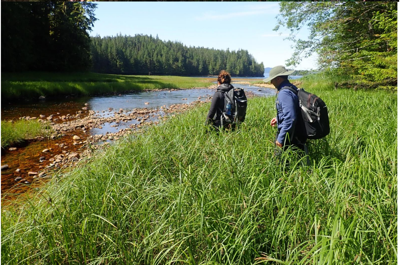
Alojamiento: Cabaña compartida