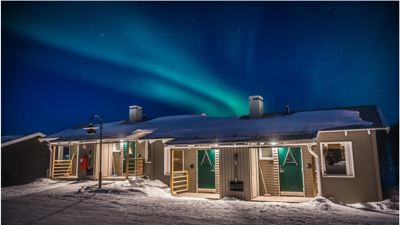
Alojamiento en Camp Ripan en cottages en Regimen AD o similar